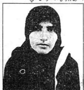
ميرپورخاص: عورت مؤنس خلاف احتجاج ڪري رهي آهي

پٽ شاھ (ڊا) اصغر علم ۽ عمل تحريڪ پاڪستان جي چيئرمين انجنيئر سيد حسين موسوي تحريڪ پاران پٽ شاھ ۾ منعقد ٿيل 2 ڏينهن واري تربيتي مئيجسٽر ورڪشاپ ۾ ڳالهائيندي ڪيو ان وڌيڪ چيو ته دين کي مسجد ۽ امام بارگاهن تائين محدود ڪرڻ سان معاشري جي اصلاح ممڪن ناهي، ضرورت ان ڳالهه جي آهي ته معاشري جي سماجي مسئلن ۽ پهلون تي پڻ منظم نموني سان ڪم ڪرڻ جي ضرورت آهي. دين جي نالي تي ٿيندڙ انگ رستن جو دين سان ڪو به تعلق ناهي، ٿلسميان جا مريض بارڙا رت جي لاءِ پيشان هجن ٿا ان لاءِ ضروري آهي ته امام حسين عليه السلام جي نالي تي رت انسان جي زندگي کي بچائڻ لاءِ ڏين ڪهرجي، اصغر علم تحريڪ سنڌ ۾ ان جدوجهد کي عملي جامون پهرائڻ لاءِ ڪوشش آهي.