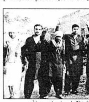
رن جي آزار خلاف احتجاج ڪري رهيا آهن

ٽن ۾ گذريل ڪيترن ئي سالن کان وٺي مچر مار جنهن سبب رهواسي سخت پريشان آهن، مچرن جي بهارو پڻ مبتلا ٿي چڪا آهن پر هن وقت تائين ٻي پاران ڪي به اهڙا نه ورتا ويا آهن، رهواسين جو ريزاي ڪشي ۽ مچر مار اسيري ڪرائڻ جو مطالبو ٻي مختلف ڳوٺن جي رهواسين برهان نئين، زوهيب صحافين سان ڳالهائيندي هٿن چيو ته ٿاڻن ڪاميٽي مچر مار اسيري نه ٿيڻ ڪري اسان سخت پريشان ڪري ڇڏي آهي ته پتي پاسي مچرن جي چڪ سبب سان اسپتالون سٺيل آهن، مليريا کان و ٿاڻن بلاقتن ۾ لاڳي ڇو مچر مار اسيري ٿو ڪرايو وڃي ۽ ن خبر ناهي ته آخر مليريا کان بچيت ڪشي ٿو خرچ چوندڙن نمائندن توڙي ٿاڻن انتظاميا کان گهر ڪشي ڳوٺن ۾ مچر مار اسيري ڪرايو وڃي ته جيئن رهواسي